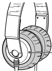
들기 Tactile dot