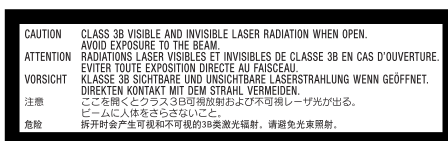
Located underneath keyboard