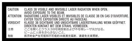
Located underneath keyboard